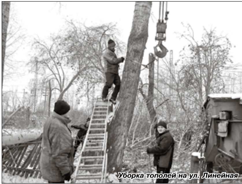
Уборка тополей на ул. Линейная