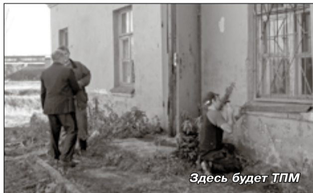
Здесь будет ТПМ

мало сделано и в коммунальной сфере Проскокова. Например, капитально отремонтированы сразу три многоквартирных дома: Совхозная, 18, 19 и Школьная, 6. На улице Совхозная коммунальщики заменили 700 метров теплотрассы, а это значит, что тепло в квартирах будет. Качественно подготовились к зиме котельная, школа, детский сад. Огромная работа проведена по благоустройству. Здесь неограниченную помощь оказали рабочие, устроенные через Службу занятости. Они не только порядок на сельских улицах наводили, но и занимались ремонтом в муниципальных учреждениях, красили заборы, убирали мусор на кладбищах. Сейчас даже невооруженным взглядом видно, насколько стало чище и аккуратнее в селах. Заметно поубавилось и огромных тополей. Ны-