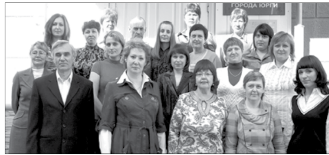
15 мая 2011 года исполнилось 20 лет со дня образования Службы занятости населения в г. Юрге