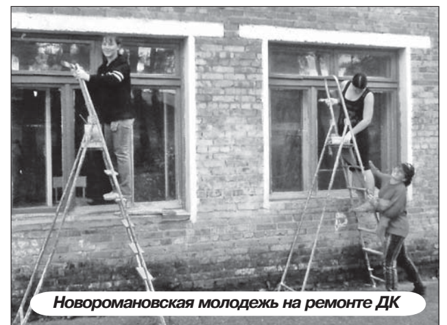
Новоромановская молодежь на ремонте ДК

— В каком состоянии отопительная система и электроснабжение?