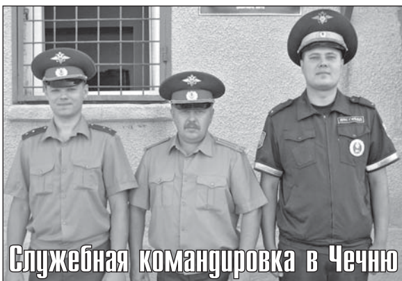
Служебная командировка в Чечню

По состоянию на 19 августа хозяйствами Юргинского района заготовлено 11,722 тонны сена и 36,642 тонны сенажа, что составляет 110,5 % и 73,4 % к плану соответственно. 16 августа в районе стартовала уборочная кампания. К уборке зерновых приступили сразу три хозяйства — ООО «Земляне», ООО «Новые Зори» и ООО «Юргинский». К 19 августа ими обмолочено уже 908 гектаров, намолочено 1949 тонн зерна. Всего в этом году хлеборобам района предстоит убрать зерновые с площади 50 тыс. гектаров.