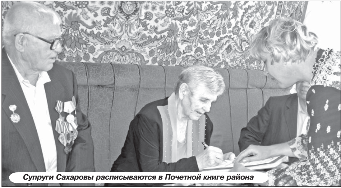
Супруги Сахаровы расписываются в Почетной книге района